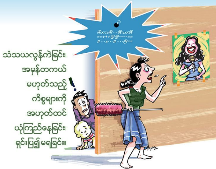
သံသယလွန်ကဲခြင်း၊ အမှန်တကယ်မဟုတ်သည့် ကိစ္စများကို အဟုတ်ထင် ယုံကြည်နေခြင်း၊ ရှင်းပြ၍ မရခြင်း။