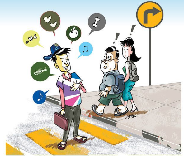
ပုံမှန်မဟုတ်သော၊ နားမလည်နိုင်သော အမူအရာများရှိခြင်း။ (ဥပမာ - တစ်ယောက်တည်း စကားပြောခြင်း၊ ပြုံးခြင်း၊ အကြောင်းမဲ့ကစားကစားရယ်ခြင်း)