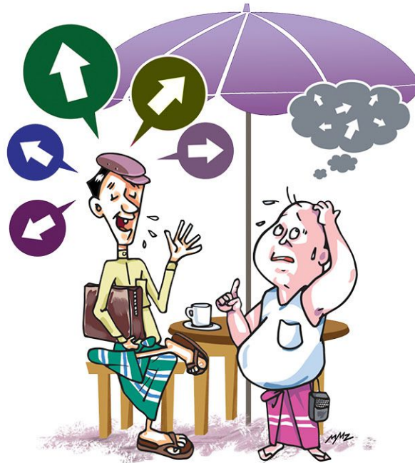
စကားပြောမမှန်၊ အဆက်အစပ်မရှိသော စကားများကို ပြောခြင်း။