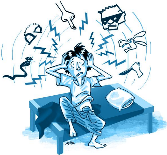
ပြောဆိုမှုမရှိသော အသံများကို ကြားနေခြင်း၊ တကယ်မရှိသော အရာများကို မြင်ရခြင်း။