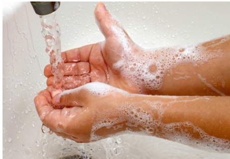
အသည်းရောင်အသားဝါ (အေ) ရောဂါပိုး ကာကွယ်ဆေးထိုးနှံခြင်းဖြင့် ကာကွယ်နိုင်ပါတယ်။