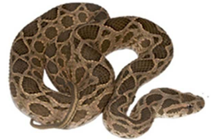
Eastern Russells' viper (မြေပွေး) ဝမ်းဗိုက်မှ မြင်ရပုံ