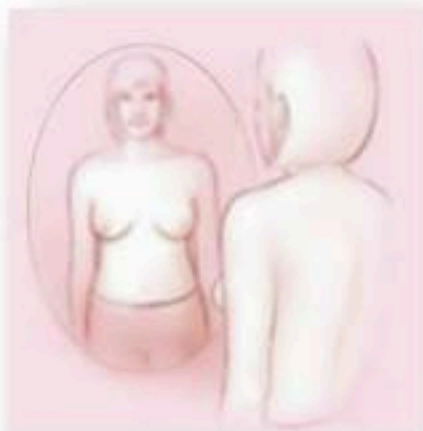
လက်နှစ်ဖက်ကို ခန္ဓာကိုယ်ဘေးတွင်ချပါ။

မှန်ရှေ့တွင် ခန္ဓာကိုယ်အနေအထား(၃)ခုဖြင့် စစ်ဆေးရမည်။