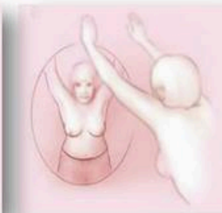
လက်နှစ်ဖက်ကို ခေါင်းပေါ်မြောက်၍ခန္ဓာကိုယ်ကို အနည်းငယ်ကိုင်းထားပါ။