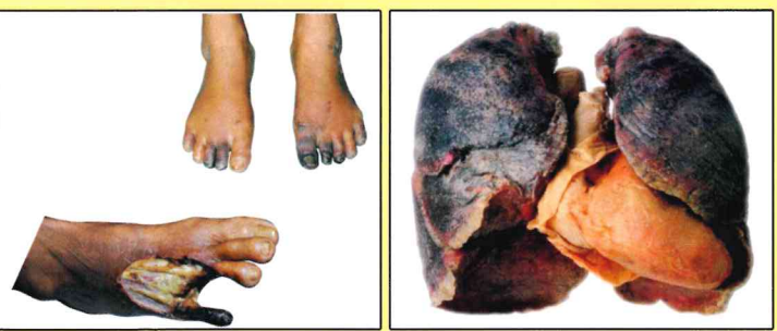
ခြေပုပ်လက်ပုပ်ရောဂါ အဆုတ်ကင်ဆာ

ဆေးလိပ်မီးခိုးငွေ့များသည် မွေးကင်းစကလေးများနှင့် လသားကလေးငယ်များတွင် -