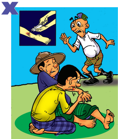
မြွေကိုက်ခံထားရသည့် ဒဏ်ရာမှ မြွေဆိပ်များကို ပါးစပ်နှင့်စုပ်ခြင်းဆေးထိုးအပ်နှင့်စုပ်ထုတ်ခြင်း မပြုရပါ။ ထိုကဲ့သို့လုပ်ခြင်းဖြင့် မြွေဆိပ်များပြန့်ထွက်လာမည်မဟုတ်ပါ။