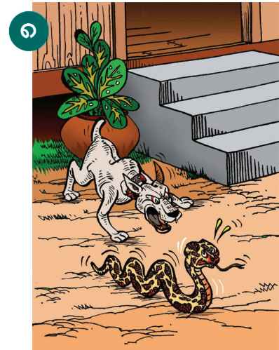
၈ အိမ်မွေးတိရစ္ဆာန်တို့၏ အမူအကျင့်ကို ကြည့်ခြင်း အားဖြင့် မြွေရိုနေခြင်းကို သိရှိနိုင်သည့်အပြင် မြွေအန္တရာယ်မှ လည်း ကာကွယ်နိုင်ပါသည်။