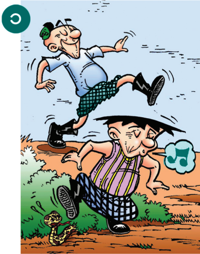
၁ သွားလာရာတွင် မြွေထောက်ကို ကာကွယ်နိုင်သော လည်ရှည်ဖိနပ်စီးထားခြင်း၊ မြွေကိုမြောက်လှန်ရန်အတွက် အသံပေးခြင်းတို့ကို ပြုလုပ်ရမည်။