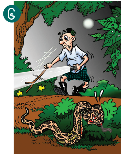
၆ အမှောင်ထဲတွင် သွားလာရာ၌ လွယ်ကူစွာမြင်နိုင်ရန် ဓာတ်မီး (သို့မဟုတ်) မီးအိမ်သုံးခြင်း၊ တုတ် နှင့် မြောက်လှန်ခြင်း၊ မြေသံပေးခြင်း တို့ပြုလုပ်ရမည်။