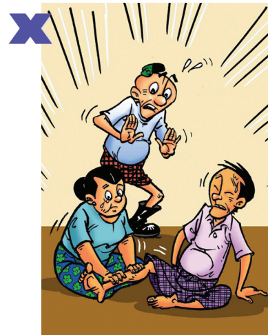
မြွေကိုက်ခံရသော ဒဏ်ရာတပိုက်အား နှိပ်နယ်ခြင်း မပြုရ၊ ခန္ဓာကိုယ်အနံ့ မြွေဆိပ်ပိုမိုပျံ့နှံ့နိုင်သည်။