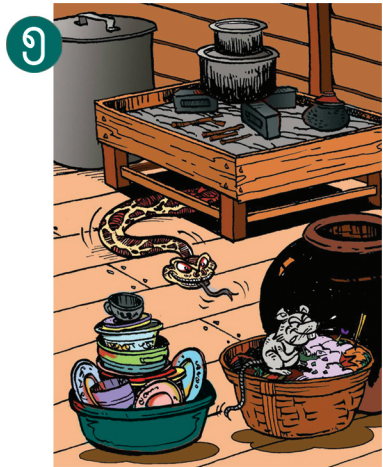
၅ အစားအစာများ၊ စားကြွင်းစားကျန်များကို သေချာစွာ ဖုံးအုပ် ထားရမည်။ သို့မဟုတ်ပါက ကြွက်များ ရိုအောင်းနိုင်ပြီး ထိုကြွက်များ၏ အစာဖြစ်သော မြွေများမိမိပတ်ဝန်းကျင်သို့ ရောက်ရှိလာနိုင်သည်။