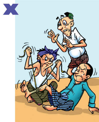
ကြပ်စည်းခြင်းမပြုရ၊ သွေးမလျှောက်ဘဲ စည်းထားသော ကိုယ်လက်အင်္ဂါ ပုပ်နိုင်သည်။