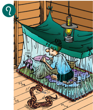
၇ အိပ်ရာဝင်ရာတွင် အိပ်ရာကို ဂရုပြုစစ်ဆေးရန်၊ ခြင်ထောင် ထောင်၍ အိပ်ရန်၊ ခြင်ထောင်အနားကို အိပ်ရာအောက်တွင် သေချာစွာ ဖိထားရန်၊ ဖြစ်နိုင်လျှင် ကြမ်းပြင်ထက် အမြင့် (စင်/ ခုတင်) တွင်အိပ်ရန် လိုအပ်သည်။