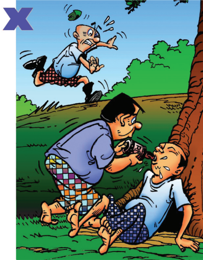
အရက် မသောက်ရ၊ မြွေဆိပ်ပြန်ပြန်ပျံ့နှံ့နိုင်သည်။