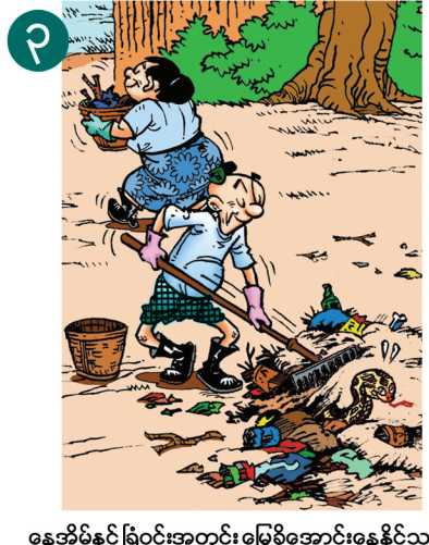
၃ နေအိမ်နှင့် ခြံဝင်းအတွင်း မြွေရိုအောင်းနေနိုင်သည့် အမှိုက်၊ မြက်ပင်ရှည်၊ မြုံပုတ်စသည်တို့ကို ရှင်းလင်းထားရမည်။ ရှင်းလင်းရာတွင်လည်း လည်ရှည် ဖိနပ်၊ လက်အိတ်စသည်တို့ကို ဝတ်ဆင်ထားရမည်။