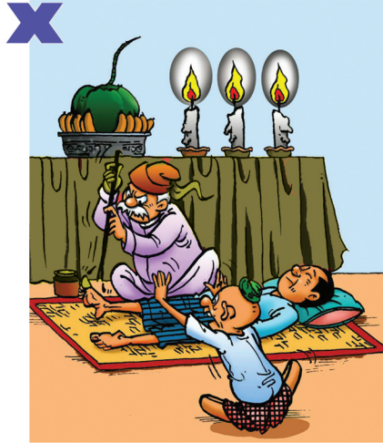
စုတ်ထိုးခြင်းမပြုရ၊ ပိုးဝင်၍အန္တရာယ်ရှိနိုင်သည်။ ဆေးရုံရောက်ရန် နှောင့်နှေးနိုင်သည်။