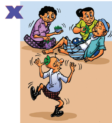
ဆေးမြီးတို့များသောက်သုံးခြင်း၊ မြွေကိုက်ဒဏ်ရာအားဆေးအုပ်ခြင်း၊ ကပ်ခြင်း၊ လိမ်းခြင်းမပြုရ၊ ပိုးဝင်၍အန္တရာယ်ရှိနိုင်သည့်အပြင် ဆေးရုံရောက်ရန်နှောင့်နှေးနိုင်သည်။