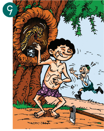
၄ တွင်း၊ သစ်ခေါင်းစသည်နေရာများသည် မြွေရိုအောင်းနေနိုင်သည့်အတွက် လက်နှင့် နှိုက်ခြင်း မပြုရ။