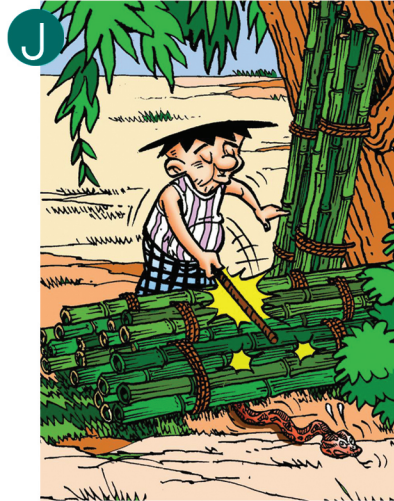
၂ သစ်ပု၊ ဝါးပု၊ ကောက်လှိုင်းစသည်တို့ကို ကိုင်တွယ်ရာတွင် ၎င်းတို့ကြား၌ မြွေရိုအောင်းနေနိုင်သည့်အတွက် ဦးစွာ ရိုက်ပုတ်၊ အသံပေးပြီးမှ ကိုင်တွယ်ရမည်။